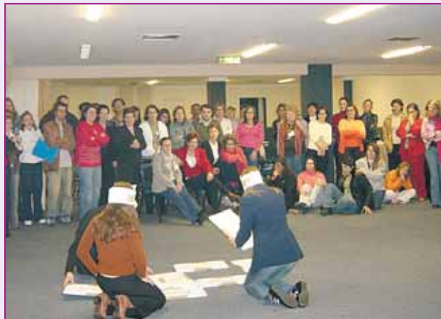
Dramatizações possibilitam reflexão sobre a temática