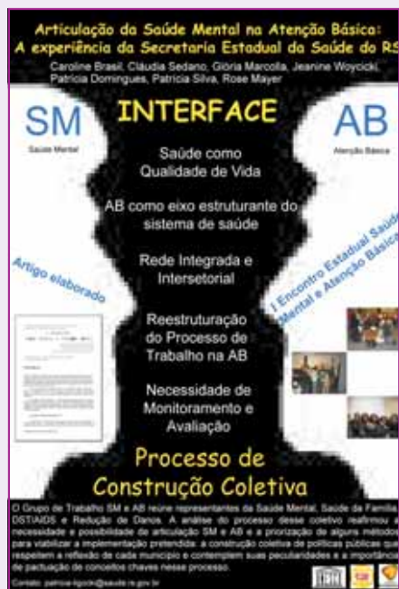
Banner com diretrizes da Saúde Mental e Atenção Básica

Outro momento importante, foi a redação do artigo "A Interface Saúde Mental e Atenção Básica", elaborado pelo GT SMAB, a ser publicado no próximo Boletim da Saúde da Escola de Saúde Pública/SES/RS. O documento também estará disponível, a partir de fevereiro de 2006, na Coordenação do Saúde Para Todos, na Avenida Borges de Medeiros, 1501, 5º andar, em PoA/RS.